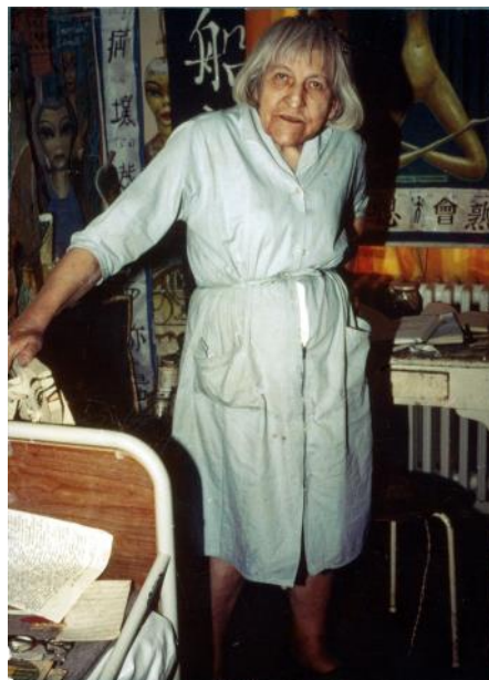
Et foto af kunstneren selv.